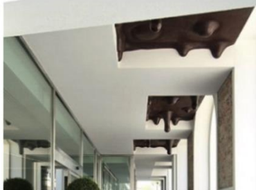
Selbst von der Decke tropft Schokolade