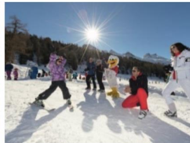
Animiertes Spiel und Spass im Skigebiet