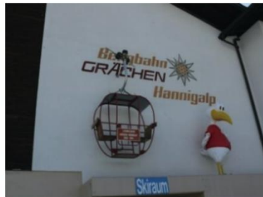
Eine klare Beschilderung hilft dem Gast, sich zu orientieren