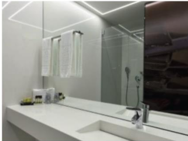
Das Bad bietet dem Gast viel Ablageplatz