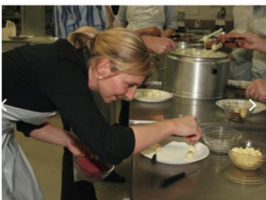
Gäste helfen bei der Zubereitung des Abendessens im Hotel mit