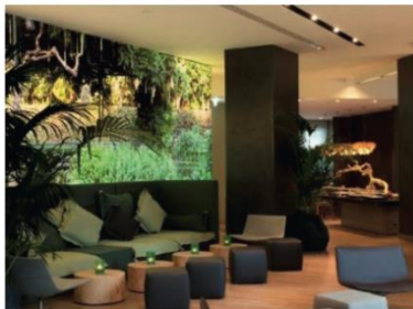
Ruhemöglichkeiten strukturieren den Raum und laden zum Verweilen ein