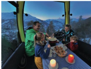
Fondueplausch in der Gondel