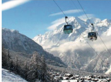
Bergpanorama als Märchenwelt