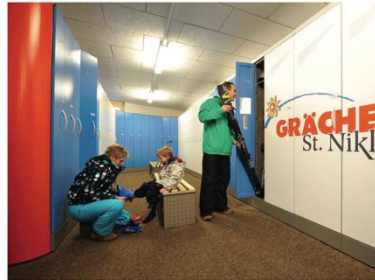
Stressfreie Vorbereitung auf den Skitag dank grossem Skiraum mit Heizung für Skischuhe