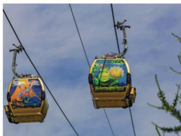
Bergbahn als «Märchenwelt»