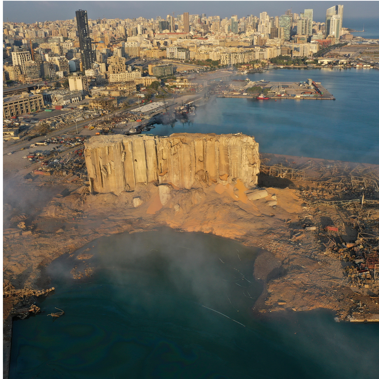
Dégâts dans le port de Beyrouth après l'explosion du 4.8.2020

Lorsque des produits chimiques incompatibles sont mélangés.