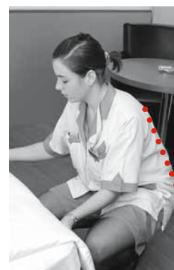
Fig. 9 e 10: una postura corretta (schiena dritta) aiuta a prevenire i danni alla schiena