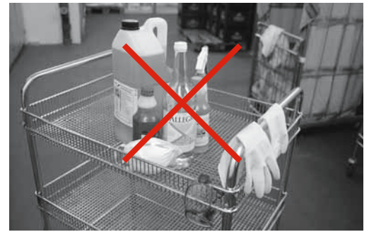
Fig. 5: per evitare intossicazioni conservare i detergenti nei contenitori originali.