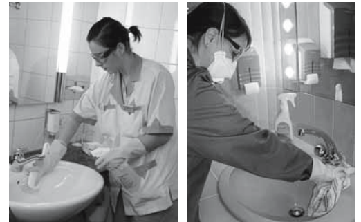
Figure 6, 7: proteggersi quando si usano decalcificanti acidi. Se l'aerazione è insufficiente, usare la mascherina.