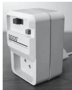
Fig. 1: le prese salvavita (interruttori FI) si trovano nei negozi specializzati.

Nota: i pavimenti in ceramica o pietra si possono rendere antiscivolo anche in un secondo tempo.