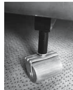
Fig. 2: applicare rotelle al letto permette di rifare il letto senza danneggiare la schiena.