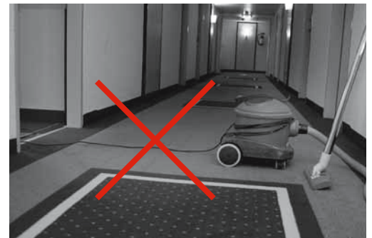
Fig. 8: i cavi a terra nei corridoi possono far inciampare.