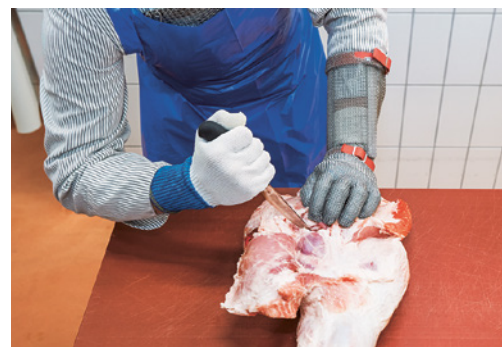
Bild 6: Ausbeinen mit Stichschutzhandschuh und Stichschutzschürze