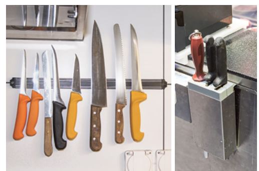
Bild 4: Geeignete Orte sind etwa Messerkorb, Steck- oder Magnethalter.