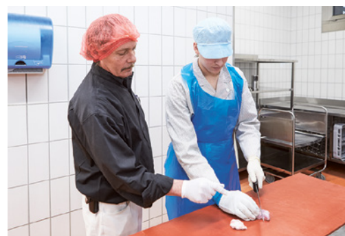
Bild 8: Instruktion der Mitarbeitenden, siehe auch SAFE AT WORK, Schulungskit Fleischwirtschaft und Metzgereigewerbe.

Es ist möglich, dass in Ihrem Betrieb noch weitere Gefährdungen zum Thema dieser Checkliste bestehen. Ist dies der Fall, treffen Sie die notwendigen Massnahmen (siehe Rückseite).