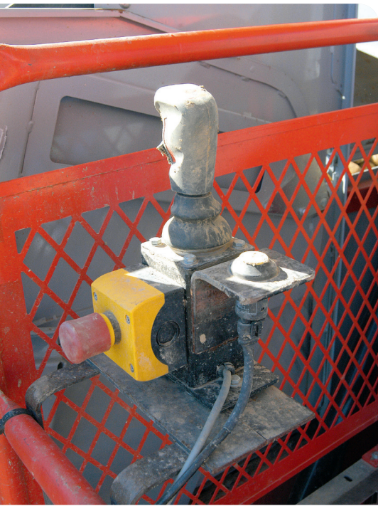
Auch bei der Bedienung abseits des Fahrersitzes müssen alle notwendigen Steuerbefehle ausgeführt können.