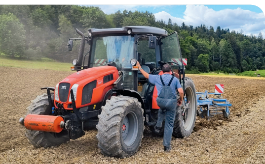
Vor dem Auf- oder Absteigen vom fahrenden Traktor muss dieser automatisch gestoppt werden.