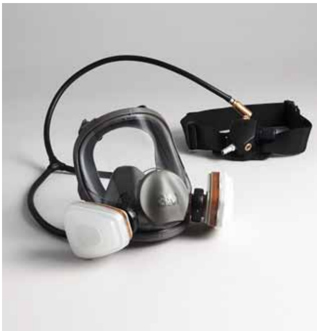
Fig. 8: maschera intera e cintura di un respiratore ad aria compressa conforme alla norma SN EN 14594.