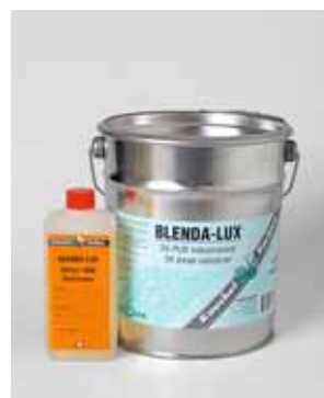
Fig. 1: induttore e resina di una vernice PUR bicomponente. L'induttore contiene isocianati.

Anche le vernici poliuretatiche monocomponenti che si induriscono con l'umidità contengono solitamente isocianati.