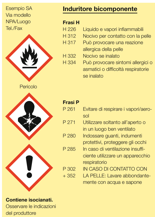
Fig. 3: etichetta di un induritore in base al sistema GHS