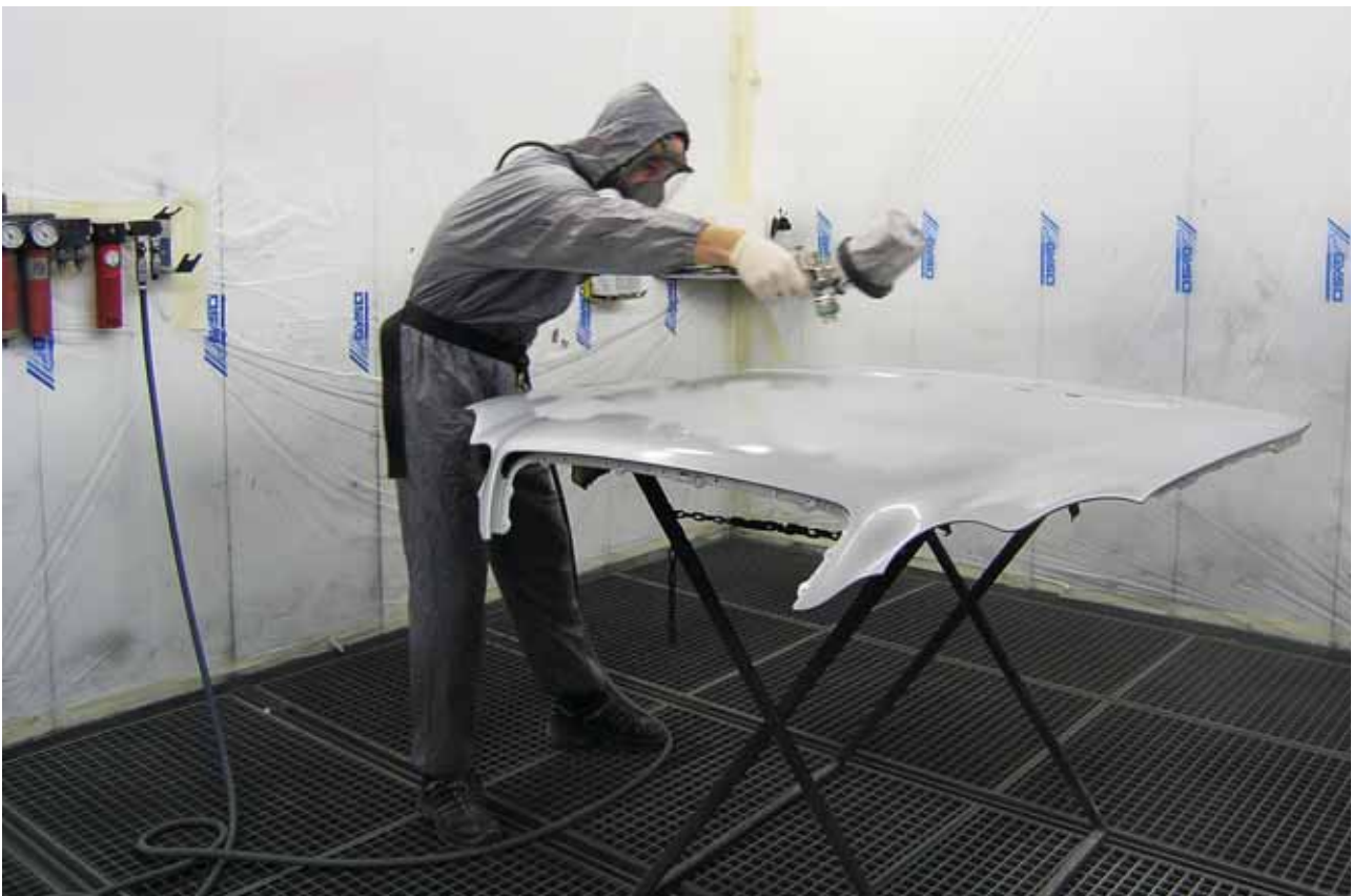
Fig. 6: operatore in una cabina di verniciatura. L'aspirazione avviene sotto il grigliato, mentre l'aria fresca viene immessa dall'alto.

Occorre verificare regolarmente se le installazioni tecniche, soprattutto gli impianti di aspirazione, funzionano correttamente. In particolar modo, bisogna sostituire al momento giusto i filtri sporchi.