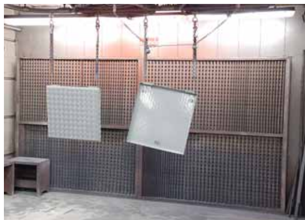
Fig. 5: posto di verniciatura con parete di aspirazione. L'aria fresca viene immessa dal lato opposto del locale. La sospensione è dotata di un dispositivo di rotazione in modo che i pezzi vengano verniciati sempre da davanti.

Per i lavori di verniciatura nell'edilizia, all'aperto o all'interno di recipienti si applicano disposizioni speciali (vedi ordinanza a pag. 2); queste disposizioni devono essere completate da misure di protezione più severe contro gli isocianati.