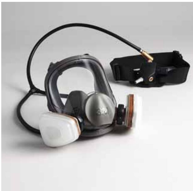
Fig. 8: masque complet et ceinture d'un appareil à adduction d'air comprimé selon SN EN 14594.