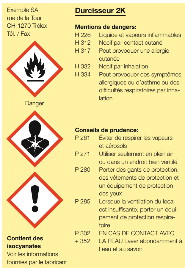
Fig. 3: étiquette d'un durcisseur selon le nouveau marquage GHS.