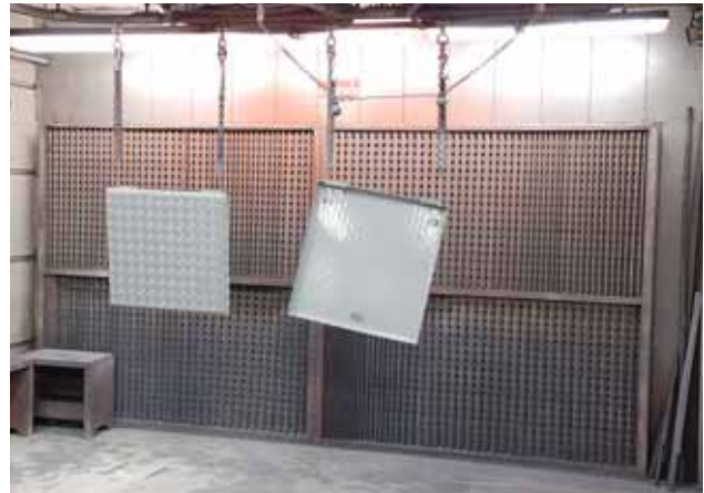
Fig. 5: poste de peinture au pistolet avec paroi aspirante. L'air frais provient de la partie opposée du local. Le système de suspension est équipé d'un dispositif rotatif permettant de toujours pulvériser les pièces de face.

Des dispositions spéciales (cf. ordonnance mentionnée à la p. 2) s'appliquent aux travaux de peinture sur des chantiers, à l'air libre ou à l'intérieur de réservoirs. Ces dispositions doivent être complétées par des mesures de protection accrues contre les isocyanates.