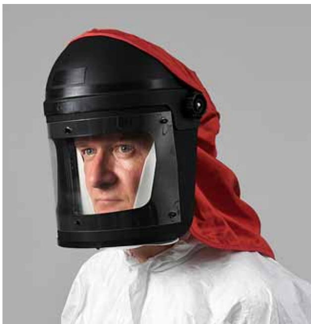
Fig. 7: cagoule de classe 3 pour appareil à adduction d'air comprimé.

Les systèmes de protection des voies respiratoires adaptés aux travaux de pulvérisation de vernis et peintures contenant des isocyanates assurent à l'utilisateur une alimentation en air traité ou filtré. Ils ne créent donc pas de résistance lors de la respiration et réduisent le risque de fuite. Les systèmes de protection des voies respiratoires adaptés sont décrits ci-après.