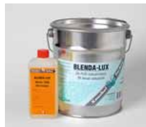
Fig. 1: durcisseur et résine d'un vernis 2K-PUR. Le durcisseur contient des isocyanates.

Même les verniss polyuréthane à un composant durcissant avec l'humidité de l'air contiennent généralement des isocyanates.