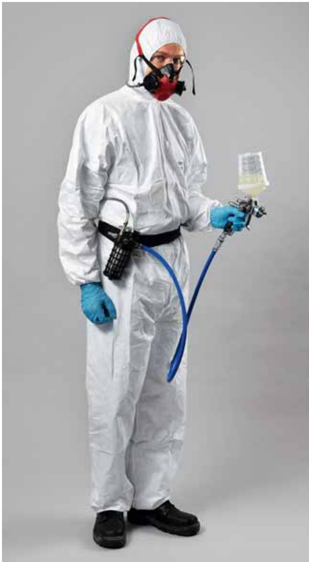
Fig. 9: EPI complet: appareil à adduction d'air comprimé selon la norme SN EN 14594 de la classe 3 avec demi-masque, lunettes de protection, combinaison de protection contre les produits chimiques (type 5) et gants. Le tuyau d'air comprimé est relié à la ceinture et alimente en air le demi-masque et le pistolet de pulvérisation.