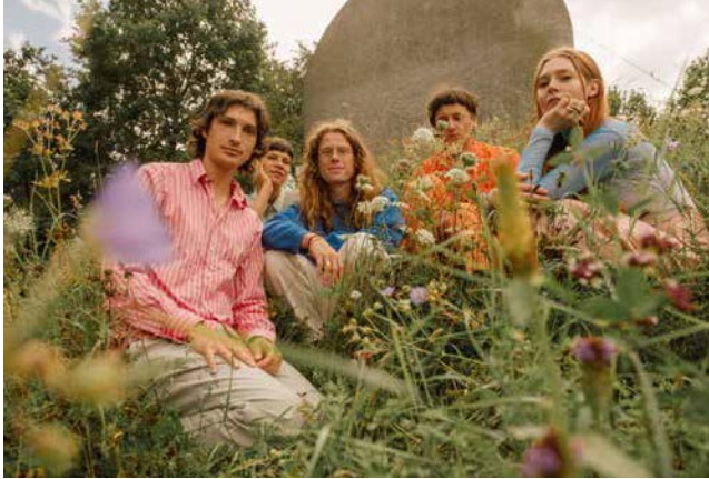
KUSH K

Fatima Moumouni & Laurin Buser, das Spoken-Word-Duo, präsentierten im Stall 6 ihr eigenes Rap-Projekt NUGGETS .