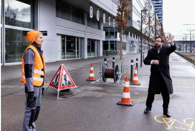
BÖRSEN HANDELN Tim Zulauf / KMU Produktionen

der Finanzwelt ein. In einem fast krimiartigen Science-Fiction-Walk wurden uns Derivate und Optionen erklärt sowie die Entkörperlichung des Börsenwesens vorgeführt.