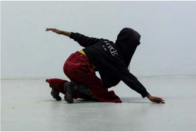
III (SOMETHING FLAT, SOMETHING COSMIC, SOMETHING ENDLESS) SERAFINE1369 © Binta Kopp

Die Arbeit III (something flat, something cosmic, something endless) der in London ansässigen Künstler*in SERAFINE1369 konnte in Zusammenarbeit mit der Shedhalle ebendort gezeigt werden. Als offener Score angelegt, kann diese