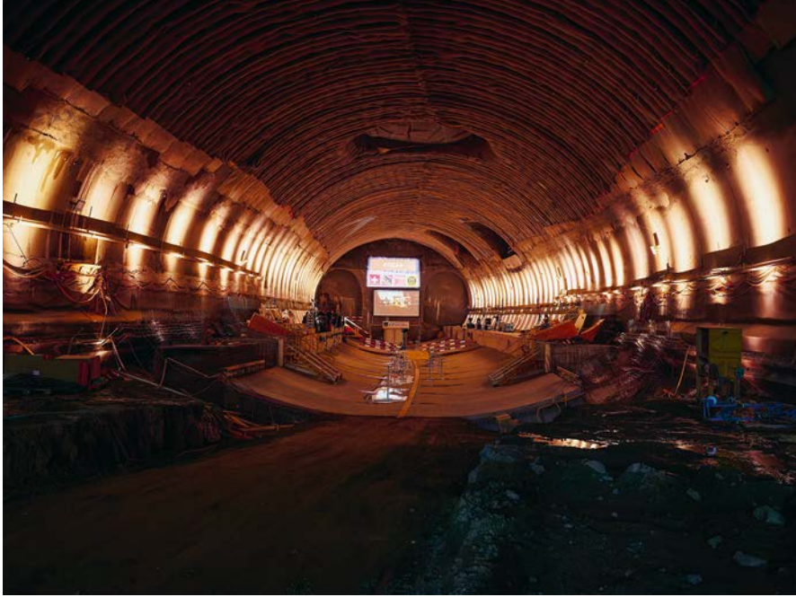
Die künftige Bahnhofhalle (Nord) vor dem grossen Event.

Um den Event auch für interessierte RBS-Mitarbeitende und Externe zugänglich zu machen, waren im Vorfeld zehn exklusive Eintritte verlost worden.