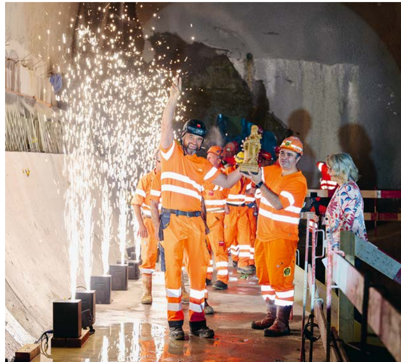
Die heilige Barbara wird von der Bauunternehmung Frutiger AG an Marti AG übergeben.